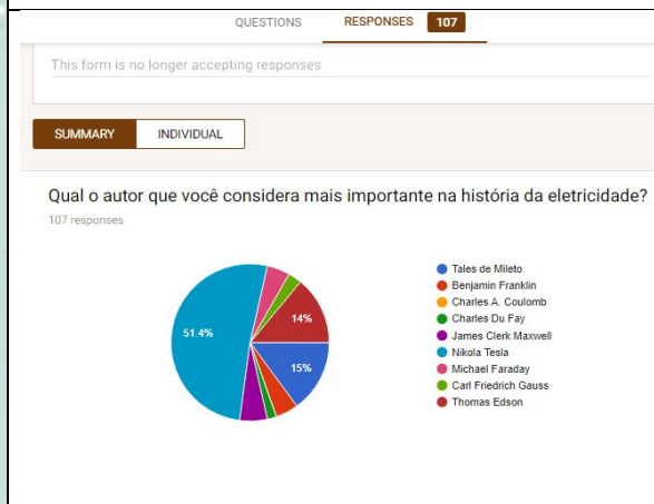
Figura 1B - Apresentação dos resultados.