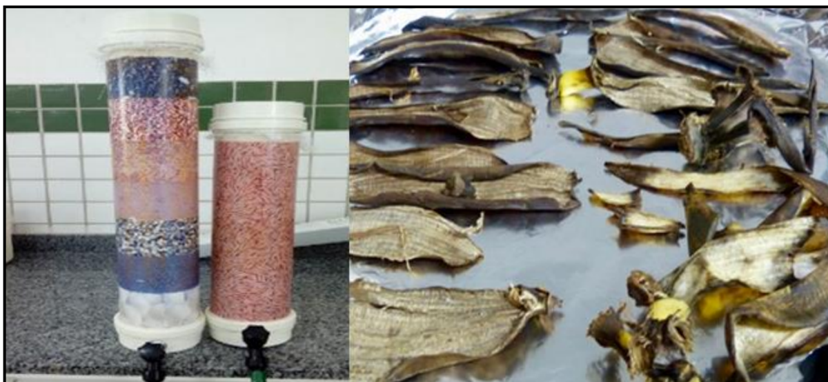
Figura 2. Filtro de cascalho, à esquerda, e filtro natural feito com casca de banana, à direita.