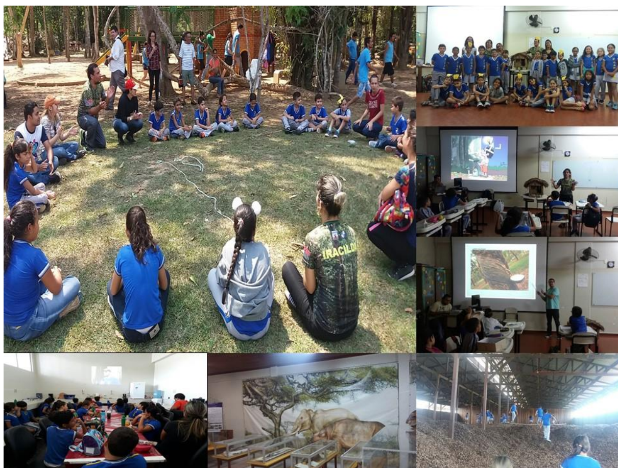
Figura 6 - Fotos com atividades desenvolvidas conjuntamente com os alunos.

Para o desenvolvimento dos conteúdos propostos formulamos cinco etapas de trabalho: elaboramos um estudo com pesquisa junto aos familiares sobre a diversidade cultural na Amazônia, além de estudos em sala de aula; os alunos pesquisaram o fluxo migratório de suas famílias para constatar suas origens e as andanças dentro dos espaços urbanos e rurais; realizamos leituras, jogos, brincadeiras e danças com a temática da diversidade sociocultural e investigação transdisciplinar com a finalidade de perceber que o outro não necessariamente é melhor ou pior, apenas é diferente; participamos de uma aula de campo, na qual visitamos o “Museu de Paleontologia da Ufac” para nos conscientizarmos de que existia vida abundante antes da chegada dos homens na Amazônia e conhecer os animais que faziam parte deste habitat ; participamos de uma aula de campo no Parque Ambiental Chico Mendes para conhecer um pouco mais sobre a fauna e a flora amazônica, conhecer a casa do seringueiro, a oca indígena, ter contato com os mitos e lendas amazônicas, além de aproveitar para praticar os jogos e brincadeiras dos negros, dos índios e dos seringueiros na área aberta do parque, vislumbrando o contato crianças-natureza.