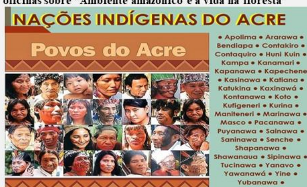
Figura 3: Nações Indígenas do Acre. Excerto que compôs as oficinas sobre “Ambiente amazônico e a vida na floresta”