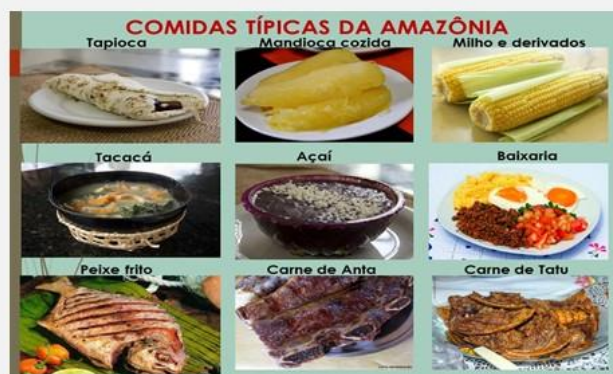
Figura 5: Excerto do material que compôs as oficinas sobre “Ambiente amazônico e a vida na floresta”