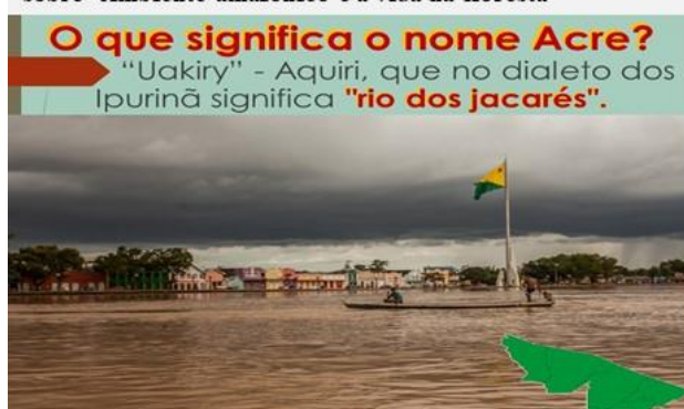
Figura 2: Excerto do material que compôs as oficinas sobre “Ambiente amazônico e a vida na floresta”

Os conteúdos foram subdivididos em cinco eixos: a) o ambiente dos seringais e a vida das populações seringueiras, negras, indígenas e andanças na floresta Amazônica; b) os animais da floresta amazônica do presente e do passado; c) andanças e fluxos migratórios indígenas, afro-brasileiros e europeus na Amazônia; d) linguagens, fala e brincadeiras dos povos da floresta; e) a história das terras e das gentes migrantes e andantes no espaço constituído.