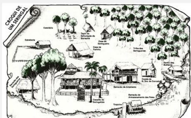
Figura 4: Croqui da Área do Museu Vila Paraíso - AM