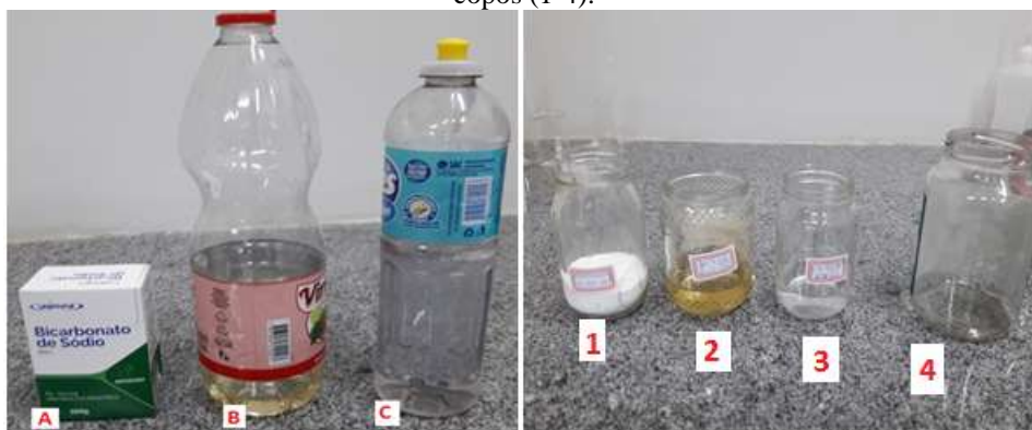
Figura 1 – Bicarbonato de Sódio (A), vinagre (B), detergente neutro (C). Materiais armazenados nos copos (1-4).

Para a realização do procedimento, é necessário o preparo previamente de uma bancada improvisada, sala de aula ou laboratório (escola de ensino fundamental ou médio) com capacidade para no máximo 25 alunos, os alunos poderão fazer um círculo para a melhor observação. Coloque todos os materiais onde eles fiquem facilmente acessíveis (Figura 1). Utilize quatro copos de vidro de extrato de tomate (250 mL) para acondicionar as amostras, vamos denominar de frasco 1 para o bicarbonato de sódio, adicione uma colher de sopa (18.8 g) de bicarbonato de sódio; para o vinagre, transfira 8 colheres de sopa (68 mL = 65.5 g) de vinagre para esse copo (frasco 2), para o frasco 3 vamos colocar o detergente, 8 colheres de sopa (50 mL = 48 g) no recipiente, frasco “4” é o recipiente vazio (Figura 1).