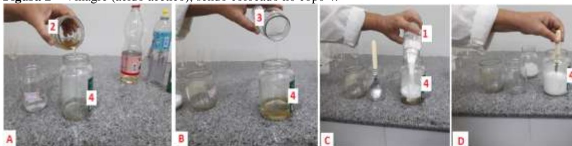
Figura 2 – Vinagre (ácido acético), sendo colocado no copo 4.

Depois use o frasco 4 para misturar os elementos, adicionando primeiro o vinagre (Figura 2A), em seguida adicione o detergente (Figura 2B) e logo em seguida o bicarbonato de sódio (Figura 2C), agitar com uma colher (Figura 2D).