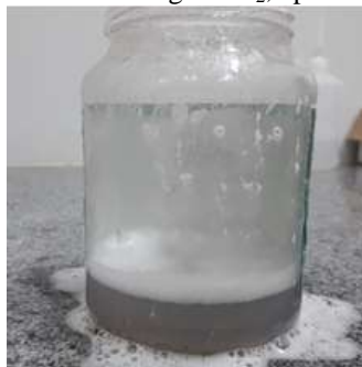
Figura 4 - Desprendimento do gás \text{CO}_2 , após formação da reação.

Depois da completa reação, em torno de quatro minutos, deixou o frasco 4 em repouso por 15 minutos, observando-se que o gás dióxido de carbono foi evaporado gerando uma solução constituída por água e o etanoato de sódio (Figura 4).