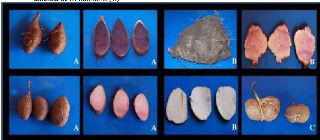
Figura 1. Variedades com polpa roxa e branca de D. trifida (A) e D. alata (B); variedade de polpa amarela de D. bulbifera (C)

Com relação ao número de espécies de cará que cada agricultor cultivava, verificou-se que 42 agricultores mantinham apenas uma espécie em suas áreas de