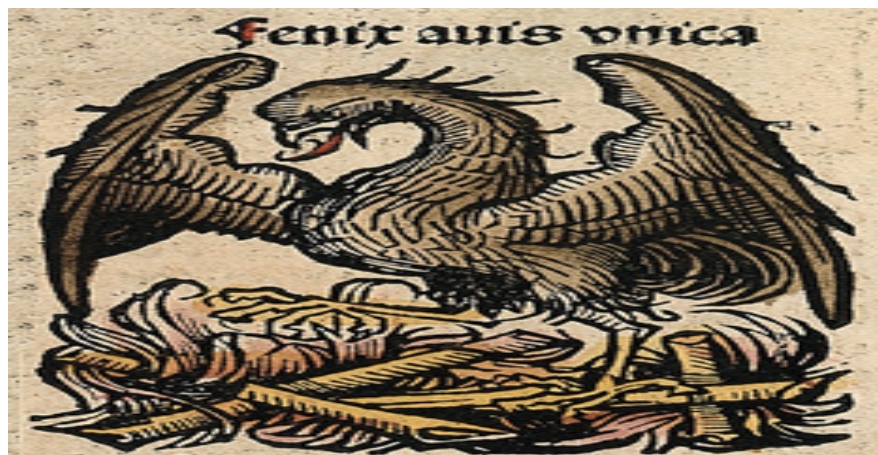
Figura 6 - A Fênix

Esse estudo mostrou que os alunos esperam muito do curso que fazem e também da profissão docente, vislumbrando mudanças em suas vidas e na sociedade por meio da educação. Há uma autoidentificação entre o grupo e a profissão docente que emerge do tema Ser professor, mostrando uma capacidade de renovação em seu processo de autoconstrução profissional. Assim, surgiu a imagem da Fênix - pássaro mitológico que renasce das próprias cinzas resultantes da sua morte. Além disso, a mitologia aponta que enquanto voava o pássaro admitia carregar sobre si pesos que ultrapassassem inclusive a estrutura física da ave, a qual dispunha de força inigualável que a permitia carregar o sobrepeso.