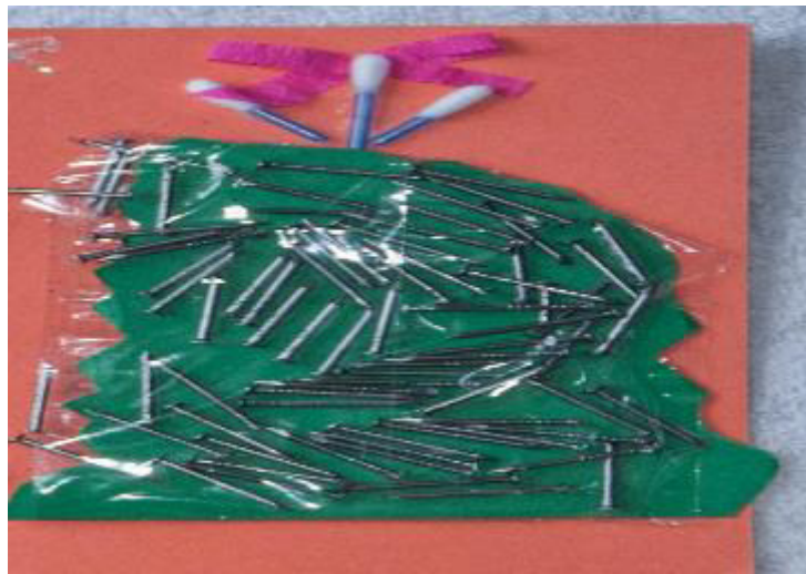
Figura 2 - A montanha

A figura 2 representa uma montanha e indica a dificuldade inerente à atuação do educador.