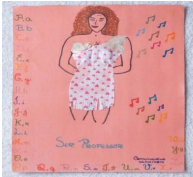
Figura 5 - A Professora Bela

Nesse contexto, o aluno Comunicativo expressa em sua produção a figura feminina para o estereótipo de professor que o aluno carrega em seu imaginário.