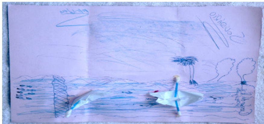
Figura 3 - O Barco

Outra imagem significativa que surge traz o barco: