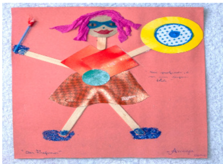
Figura 1 - O Professor Herói