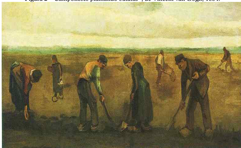
Figura 2- “Camponeses plantando batatas”, de Vincent van Gogh, 1884.