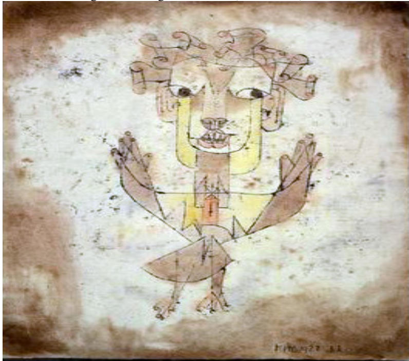
Figura 5- “Angelus Novus”, Paul Klee, 1920.