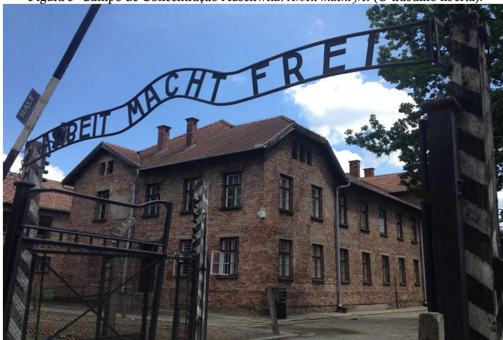
Figura 3- Campo de Concentração Auschwitz. Arbeit macht frei (O trabalho liberta).